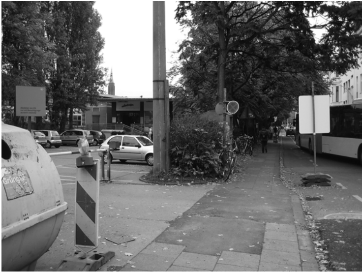
Ecke Quantiusstr. / Meckenheimer Allee

Hier soll das "Haus der Bildung" nach den Plänen der Stadt gebaut werden: